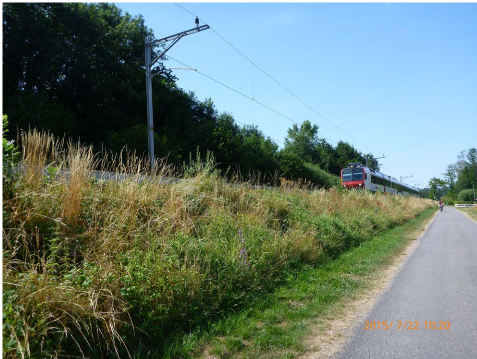
Photos de l'objet 22.07.2015